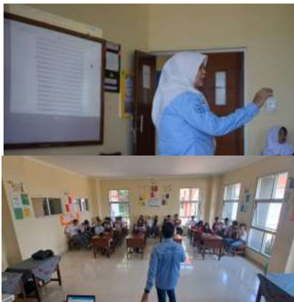
Gambar 1. Pemaparan materi