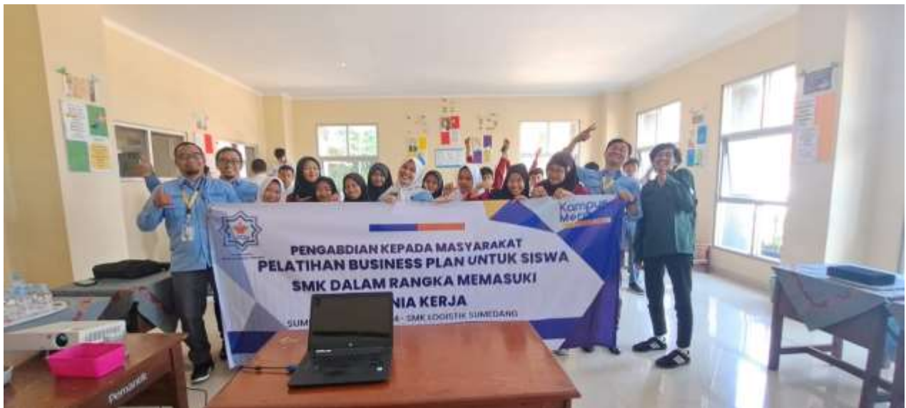
Gambar 5. Sesi Foto Bersama Siswa – Siswi SMK Logistik