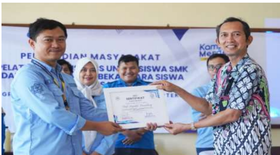
Gambar 3. Pemberian Sertifikat kepada pihak sekolah

Setelah Tim PKM kami selesai mengadakan pelatihan business plan, siswa – siswi diberikan pula sertifikat pelatihan business plan dan sekolah diberikan plakat oleh tim PKM dari UICM.