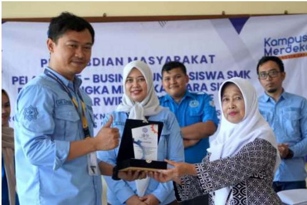
Gambar 4 Pemberian Plakat kepada pihak SMK Logistik