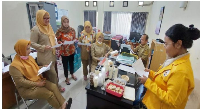
Gambar 1. Proses penilaian organoleptik

Uji organoleptik adalah ujian materi makanan berdasarkan preferensi dan minat pada suatu produk. Uji organoleptik dikenal sebagai tes sensorik atau tes indera. Pengujian ini menggunakan indera penglihatan, pencium, peraba, dan perasa. Uji organoleptik ini dilakukan oleh panelis dari Dinas Perikanan dan Peternakan Kabupaten Bogor seperti yang disajikan pada Gambar 1 dengan skor yang sudah ditentukan. Uji organoleptik yang dilakukan pada Tabel 2 merupakan uji yang dilakukan terhadap produk UKM di wilayah Kabupaten Bogor dan dapat dikatakan memiliki edaran produk yang cukup besar berdasarkan wawancara yang dilakukan pada saat penelitian berlangsung.