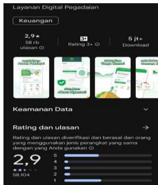
Gambar 1. Rating dan Jumlah Pengguna Aplikasi PDS

Aplikasi Pegadaian Digital Service (PDS) merupakan salah satu bentuk layanan Pegadaian berbasis online yang bertujuan membantu mempermudah nasabah dalam melakukan transaksi Pegadaian melalui berbagai bentuk transaksi dengan fitur layanan yang telah disediakan di Aplikasi ini melalui smartphone (Oktavia, Tari;Fikri, 2023; Dwi et al., 2022). Keunggulan dari Pegadaian Digital Service (PDS) ini adalah nasabah atau calon nasabah hanya perlu menjalankan aplikasi pada smartphone miliknya kemudian dapat bertransaksi secara cepat dan nyaman. Selain itu, nasabah bisa mendapatkan pelayanan setara dengan yang diberikan oleh pelayanan di Outlet Pegadaian, bahkan bisa lebih cepat dari pelayanan di Outlet karena tidak perlu antre. Dengan aplikasi pegadaian, nasabah tidak perlu datang ke outlet untuk melakukan pembayaran cukup hanya lewat aplikasi saja kemudian dibayarkan sesuai bank yang sudah ditentukan oleh Pegadaian atau melalui ATM (Oktavia, Tari;Fikri, 2023).